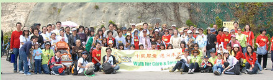
起步前，先來個大合照！