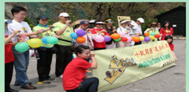
簡單而隆重的開步禮。