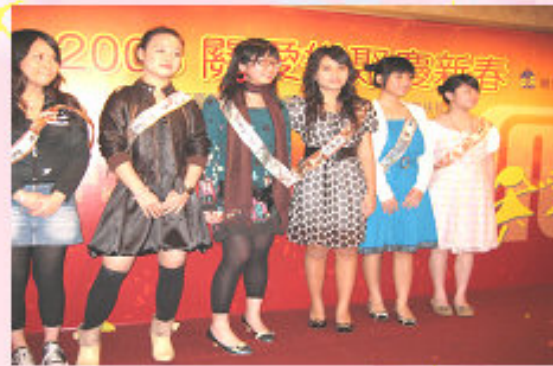
舍員落力演出，令觀眾讚不絕口呢！